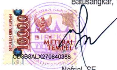
Nofrial, SE Direktur Utama